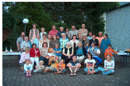
Ehren- und hauptamtliche Mitarbeiter beim Sommerfest des Solidare

2 SozialarbeiterInnen/-pädagoginnen mit insgesamt 160 % Arbeitsdeputat 1 Verwaltungskraft mit 50% 4 Familienpflegerinnen mit 260 % 1 Pfarrerin mit Sonderauftrag und 1 Mitarbeiterin (geringfügig angestellt) im SOLIDARE-Laden 2 Mitarbeiterinnen im Miteinander-Projekt 1 Honorarkraft für die Triple P Vorträge und über 65 ehrenamtliche MitarbeiterInnen.