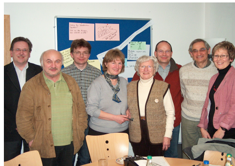
Verabschiedung der ausscheidenden DBA-Mitglieder