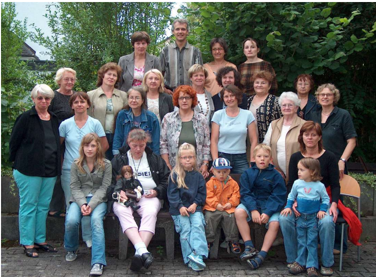
Ehren- und hauptamtliche Mitarbeiter beim Sommerfest 2007 des Solidare

Der große Kreis ehrenamtlicher MitarbeiterInnen ist nochmals gewachsen. Viele Menschen wurden verabschiedet, neue engagierte Menschen durften wir begrüßen. Ehrenamtliche Hilfe ist immer Hilfe im selbstbestimmten Zeitrahmen. So freuen wir uns über jedes neue Gesicht im Solidare, der Hausaufgabenhilfe, bei Urlaub ohne Koffer, den Selbsthilfegruppen u.a.