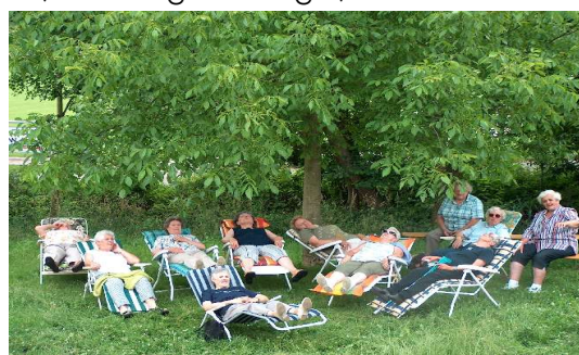
Im Liegestuhl im Schatten des Nußbaumes

Mit über 20 ehrenamtlichen MitarbeiterInnen, die in eigener Regie, die Veranstal-