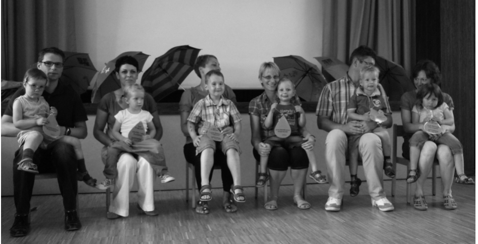
Getauft - von Gott behütet

Am 5. Juni fand der diesjährige Tauferinnerungsnachmittag in unserer Gemeinde statt.