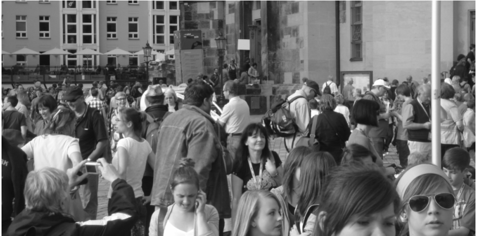
Der Platz vor der Frauenkirche

Fünf Tage Buffet vom Feinsten - die Angebote des 33. Deutschen Evangelischen Kirchentags kann man nicht anders beschreiben.