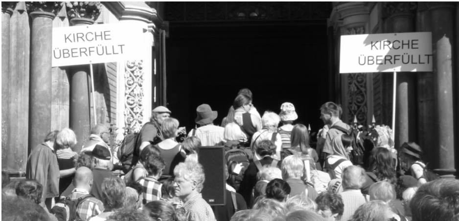
Der Eingang zur völlig überfüllten Martin-Luther-Kirche