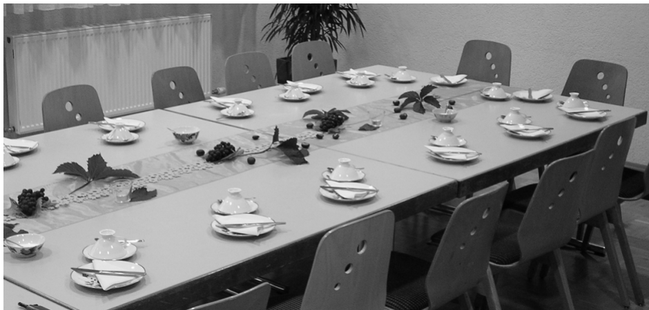
Die Kaffeetafel wartet auf die Gäste

Nach über einem Jahr Vorbereitungszeit öffneten wir am 17. April 2010 endlich die Türen für unser Trauercafé. Seitdem laden wir einmal im Monat, immer samstags von 9 - 11 Uhr, in den Martinssaal der Katholischen Kirche in Schwaigern ein. Zu Beginn waren wir unsicher. Wie viele werden wohl kommen? Wird unser Angebot überhaupt angenommen? Doch die Resonanz auf das neue Angebot sehr groß war. „Ich zähle immer die Tage, bis es wieder so weit ist“, sagte ein Gast des Trauercafés. Mit unserem Angebot möchten wir Trauernden einen geschützten Raum bieten, in dem sie mit ihrer Trauer sein dürfen. Wo weinen, lachen, schweigen und reden erlaubt sind, je nachdem, wie es einem zumute ist. Hier können alle loswerden, was sie belastet, sich mit anderen Betroffenen austauschen oder