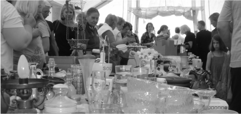
Basarstimmung im Flohmarktzelt

Am Samstag, den 28. Mai wurden wir von den vielen Spenden für den Flohmarkt überwältigt: Es kamen mehr als zwei Wagenladungen. Beim Einräumen ins Zelt wollte der Platz fast nicht ausreichen. Einiges mussten wir erst mal unter die Tische stellen und dann bei Verkauf und freiem Platz nach und nach hervorholen.