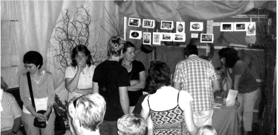
Andrang an der Kasse

Die Fakten: 308 Führungen an 28 Tagen - 9201 Gäste - 170 Mitarbeiter